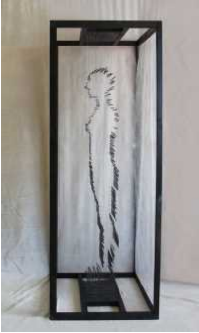
美術部全国総文祭出展作品

〈部活動の主な成績(平成29年度)〉 陸上部：県高等学校選抜大会 男子5000m競歩3位 (北信越新人大会出場) 男子走高跳8位 書道部：新潟県競書大会団体優秀賞 美術部：平成30年度全国高等学校総合文化祭(信州総文)出品決定