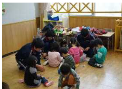
家庭科授業(保育所訪問)