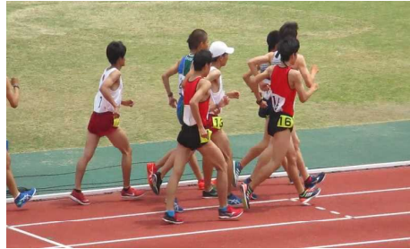
陸上競技部5000m競歩 県総体3位、北信越大会出場

〈部活動の主な成績(平成29年度)〉 陸上部：県高等学校選抜大会 男子5000m競歩3位 (北信越新人大会出場) 男子走高跳8位 書道部：新潟県競書大会団体優秀賞 美術部：平成30年度全国高等学校総合文化祭(信州総文)出品決定